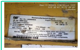
Serie Motor LH